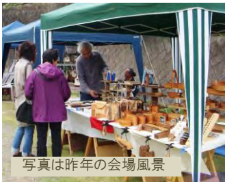
写真は昨年の会場風景